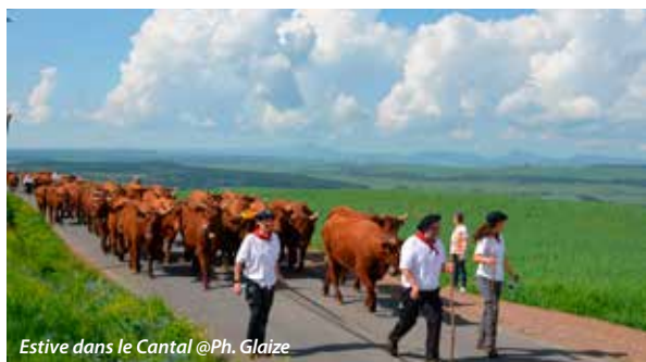
Estive dans le Cantal

➤ Comment la pratique de la transhumance vient de conduire à une reconnaissance par l'Unesco au patrimoine culturel immatériel de l'humanité ? Sous l'impulsion de la France aux côtés de plusieurs pays européens qui se sont engagés dans cette voie depuis 2019. Une pratique du pastoralisme qui conduit les éleveurs à rejoindre les pâturages avec leur bétail à un rythme saisonnier, afin d'assurer une bonne alimentation des troupeaux et une meilleure organisation des exploitations. Cette distinction vient aussi saluer toutes les valeurs qui caractérisent la transhumance. En effet, elle contribue à l'inclusion sociale, au renforcement de l'identité culturelle, à la protection de l'environnement... Raison pour laquelle le Comité intergouvernemental de l'Unesco, réuni à Kasane au Botswana, a validé cette candidature au titre de la « Transhumance déplacement saisonnier de troupeaux » en décembre 2023.