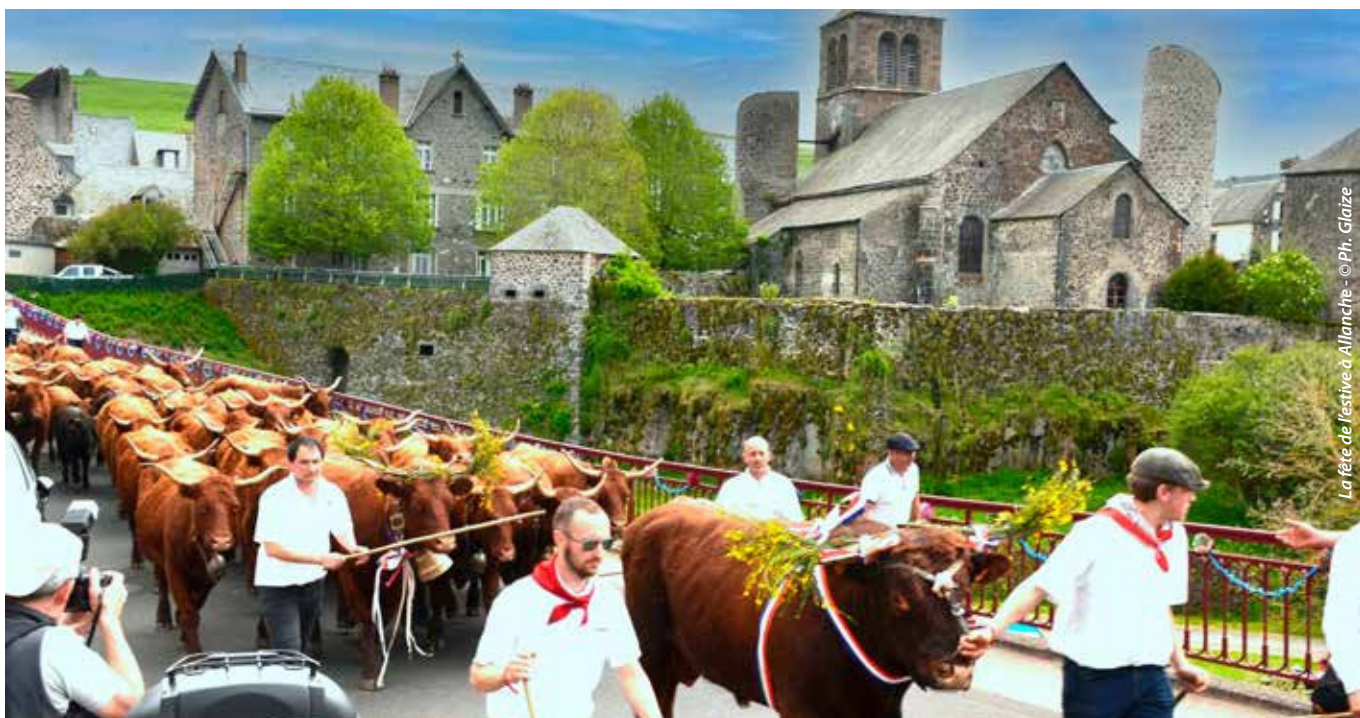
La fête de l'estive à Allanche